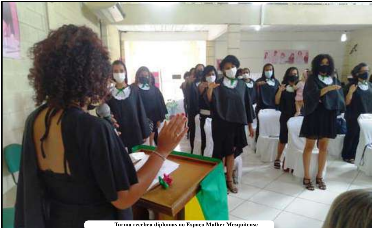
Turma recebeu diplomas no Espaço Mulher Mesquitense

“Vi os obstáculos de cada uma dessas mulheres para conseguir chegar ao final deste curso. Foi um