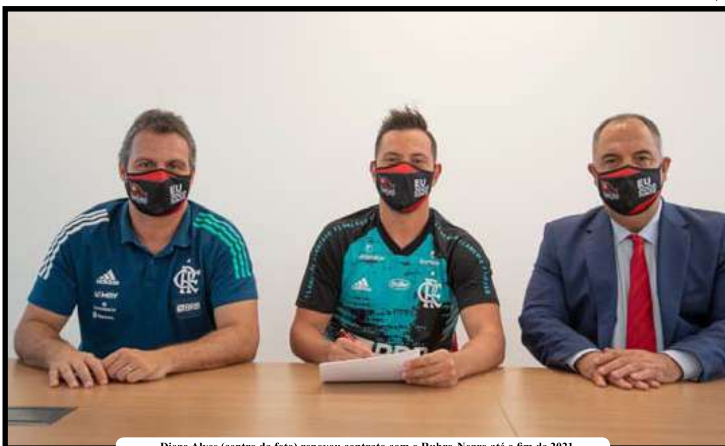
Diego Alves (centro da foto) renovou contrato com o Rubro-Negro até o fim de 2021

“Estou aqui para anunciar minha renovação de contrato. Mais um ano vestindo este Manto Sagrado. Poder estender esse vínculo vitorioso com todos vocês. Dizer que hoje estou no lugar onde meu coração quer. Estou muito feliz, es-