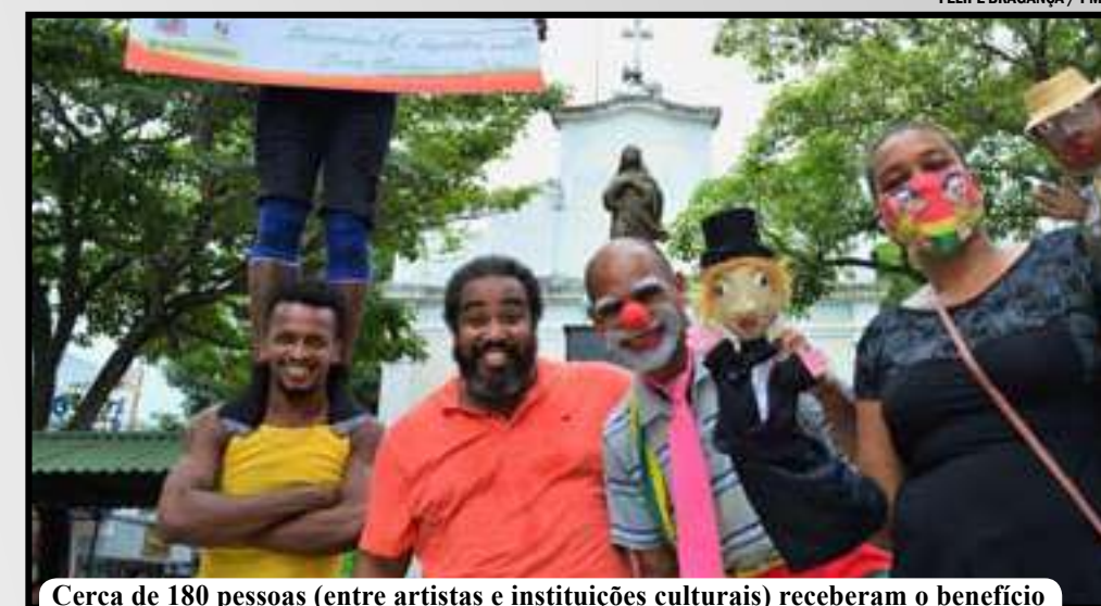
Cerca de 180 pessoas (entre artistas e instituições culturais) receberam o benefício

culturais foi rápida e sem problemas graças ao Fundo Municipal de Cultura. Ter acesso ao dinheiro através dele foi essencial