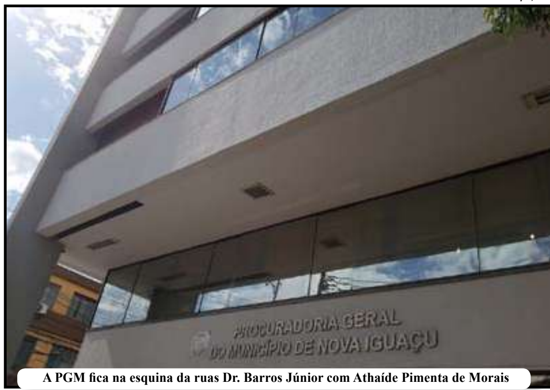
A PGM fica na esquina das ruas Dr. Barros Júnior com Athaide Pimenta de Morais

O prazo para inscrições será de hoje até 10 de janeiro. O candidato deverá preencher formu-