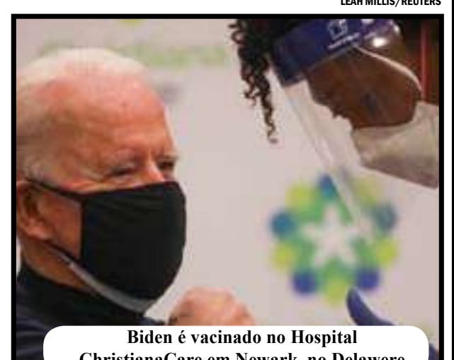
Biden é vacinado no Hospital ChristianaCare em Newark, no Delaware

A vacina da Pfizer foi a primeira a ser aprovada no país, ainda no início desta semana. Na segunda-feira da semana passada, hospitais começaram a vacinar profissionais da saúde, idosos e membros do grupo de risco.