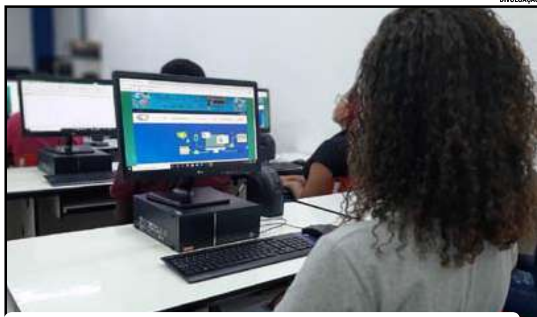
Em 2021, serão 160 mil matrículas com 20 mil vagas em cada fase

A primeira etapa terá início no dia 25 de janeiro e toda a plataforma de acesso aos conteúdos dos cursos será virtual. O principal objetivo da oferta dos cursos a distância é proporcionar