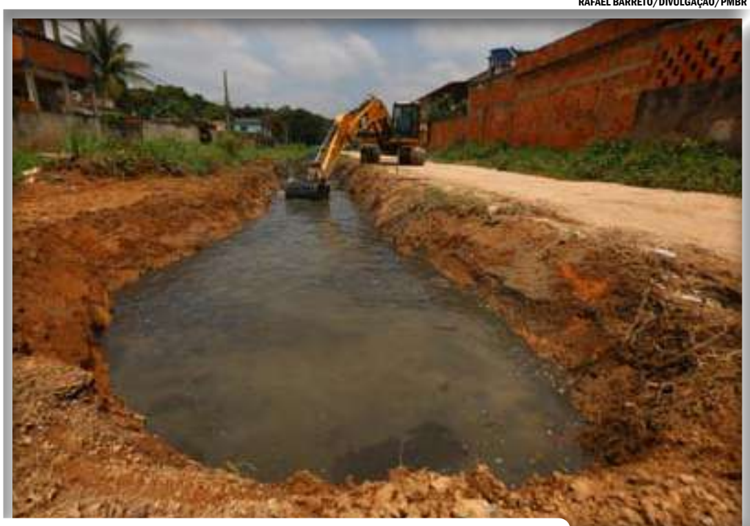
Escavadeira hidráulica trabalha na limpeza e desassoreamento do canal no bairro Roseiral